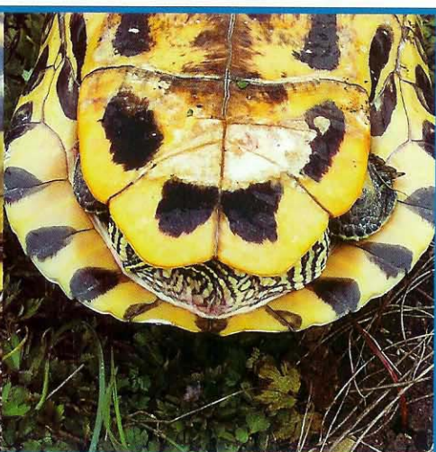
Bauchansicht Weibchen Fotos U. Eggenschwiler