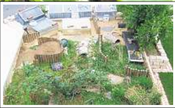
So sollte es sein: Eine Griechische Landschildkröte knabbert in einem artgerechten Freigehege (kleines Bild).