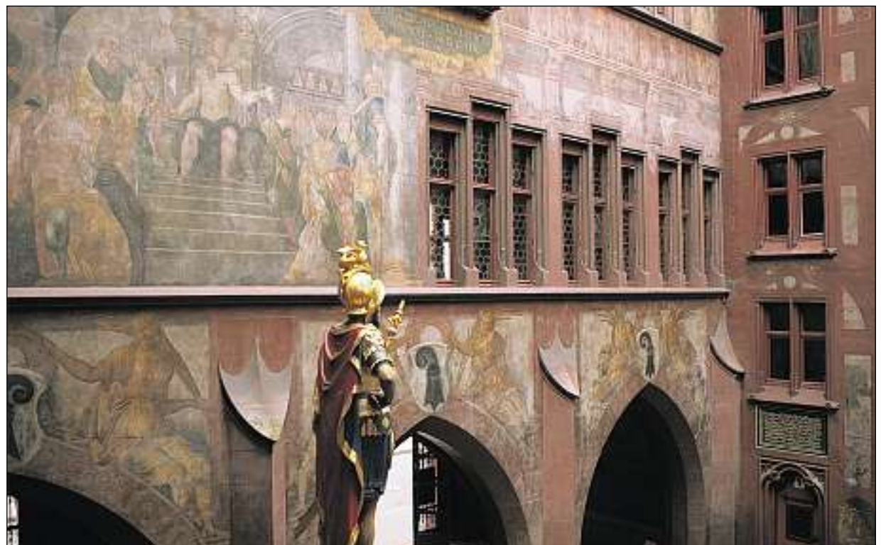
Nur in Basel zu sehen: ein Original-Wandgemälde aus Ölfarbe.

Das Gemälde an der Fassade zum Innenhof hingegen wurde in der Renovationsphase von 1978 bis 1983 restauriert und in seinen Originalzustand zurückversetzt, erklärte Res-