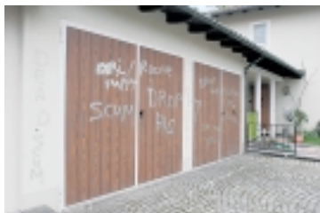
Kein Einzelfall. Pharmafirmen werden vermehrt attackiert.

Zwar distanziert sich SHAC auf der Webseite von illegalen Aktivitäten. In