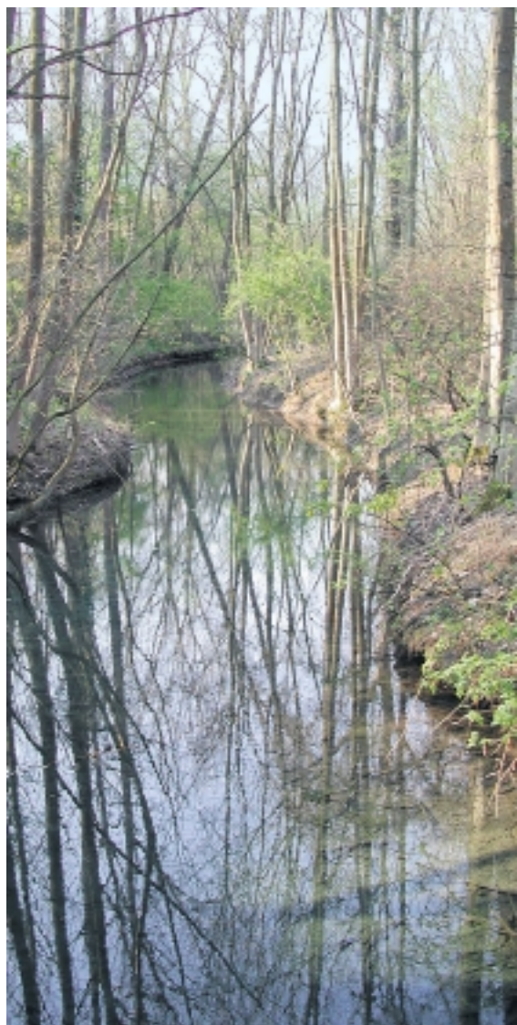
Auenlandschaft. Schon bald dürfte die Petite Camargue Alsacienne bis auf die Rheininsel wachsen.

Das Naturschutzgebiet wird auf 300 Hektar erweitert, schon bald sogar auf 900 Hektar